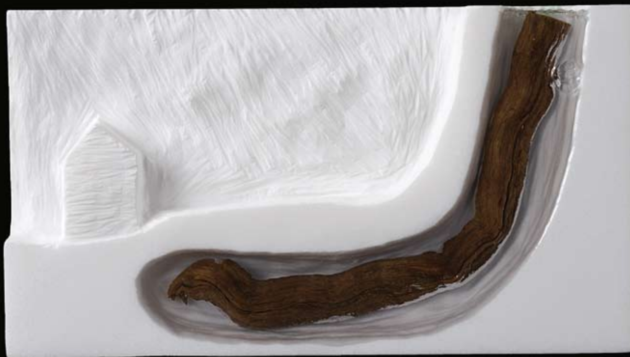
PAISAJES DEL ALMA VIII 15 x 27 x 4 cm. Mármol, resina de poliéster y madera