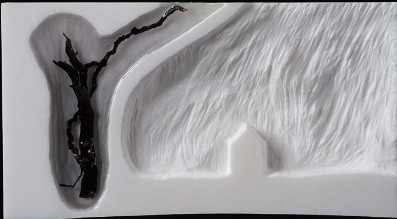
PAISAJES DEL ALMA VII 15 x 27 x 4 cm. Mármol, resina de poliéster y madera