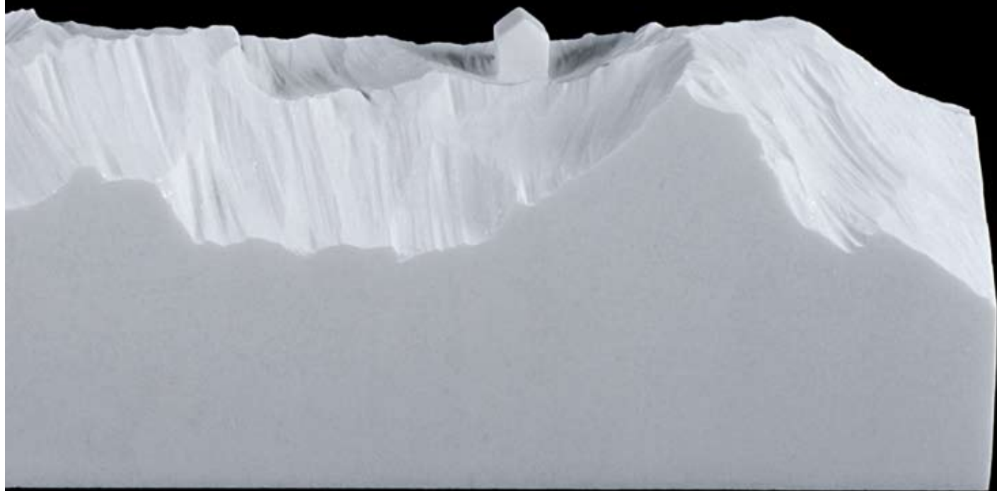
ARBORECER IV 14,5 x 67 x 14 cm. Mármol