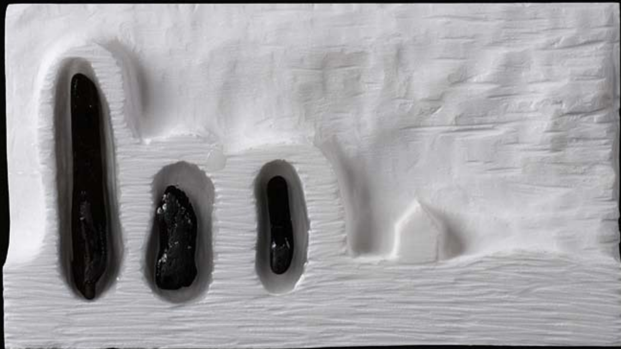
PAISAJES DEL ALMA V 15 x 27 x 4 cm. Mármol, resina de poliéster y madera