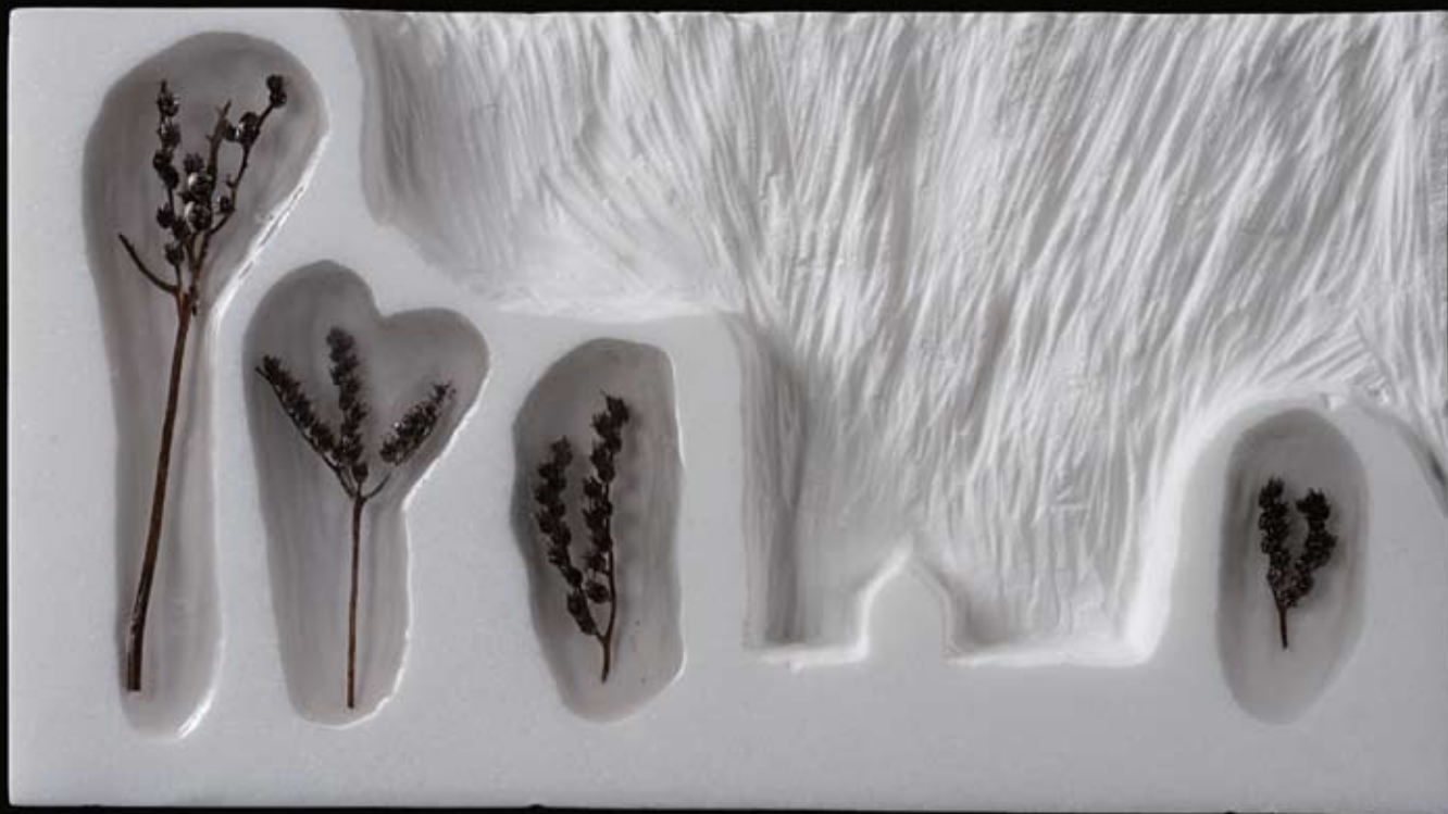
PAISAJES DEL ALMA I 15 x 27 x 4 cm. Mármol, resina de poliéster y madera