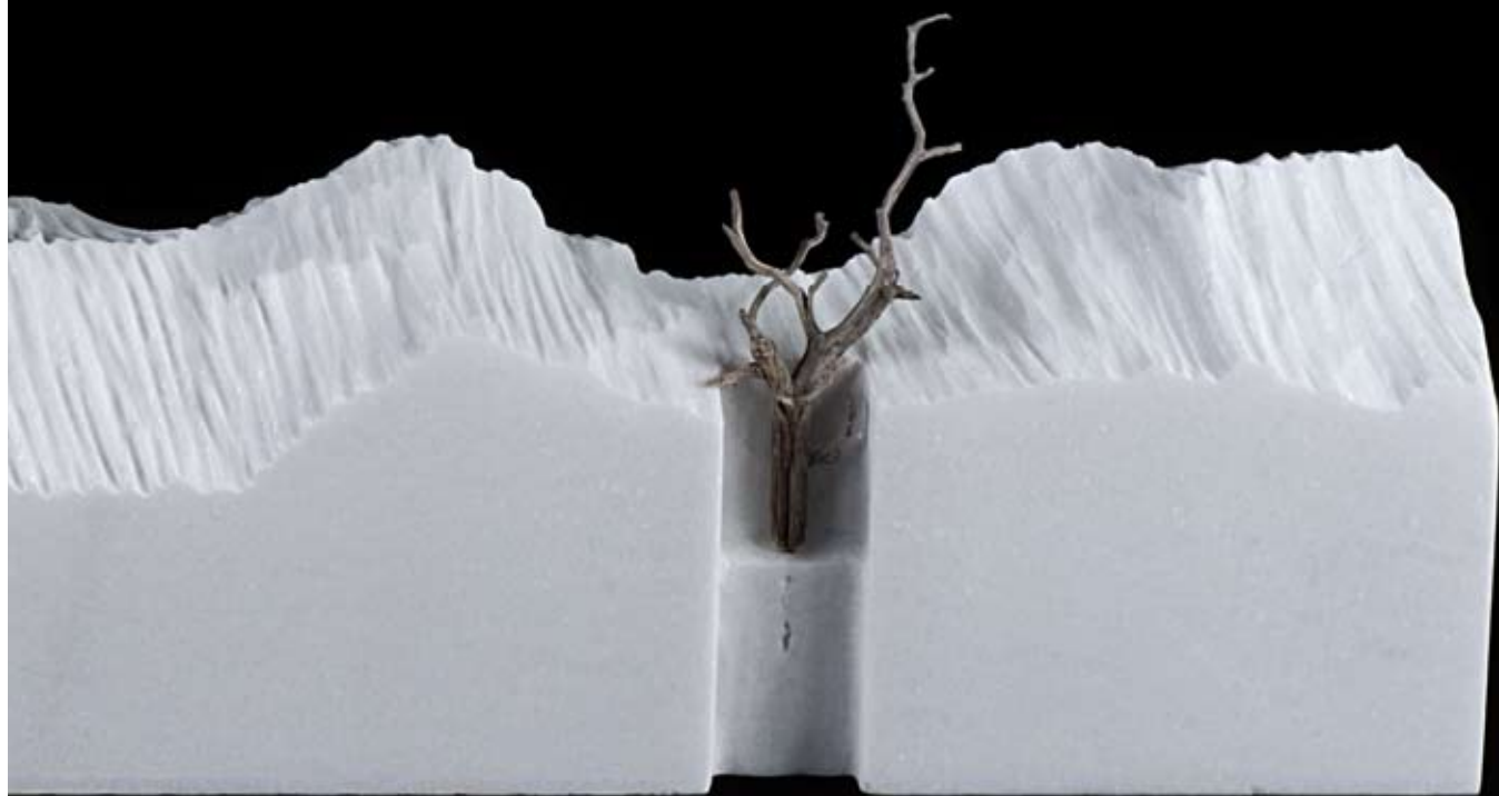
ARBORECER III 19 x 67 x 10 cm. Mármol y madera