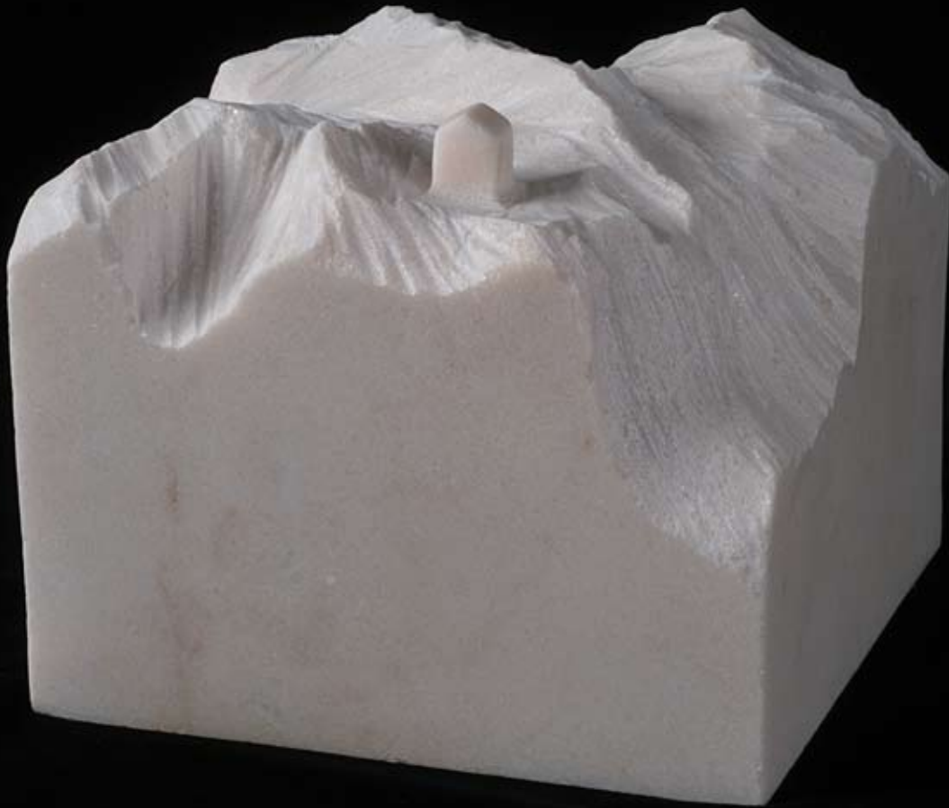
UN LUGAR EN EL MUNDO III 17 x 20 x 20 cm. Mármol